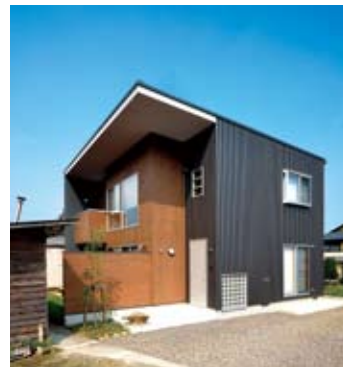
無垢材とガルバニウム鋼板を組み合わせた外観。ひさしを長く出して、家に入る光を調節。