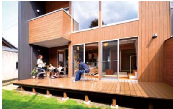
第2のリビングとして活用しているウッドデッキ。「このウッドデッキに雪が積もる景色がよかった」とS主人お気に入りの場所でもあるそう。